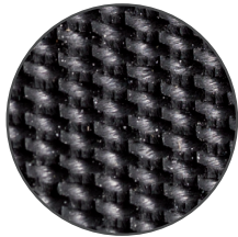
Rückseite bottom surface

Bodenbeläge für Bahnhöfe, Flughäfen, Hallen, Werkstätten, Züge und Busse field of application floorings for railway stations, airports, halls, workshops, trains and buses